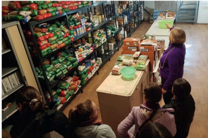
Rencontre des enfants avec la présidente du Secours Populaire

Comment occuper vos enfants ou petits-enfants pendant les vacances ? Pourquoi ne pas leur proposer une journée en paroisse. Depuis plusieurs années, la catéchèse paroissiale des douze apôtres en pays d'Aix organise une journée à chaque vacances pour les jeunes de 7 à 17 ans.